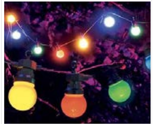
Manifestations extérieures : Pensez à une déco guinguette Guirlande B22 jusqu'à 100m - Redécoupable 4W par douille - 3 ampoules par mètre Guirlande (multiple de 10m) Fiches de raccordement Lampes B22 à LED 1W : Blanc 6000K, Blanc chaud 3000K, Rouge, Bleu, Vert, Jaune, Rose, Orange