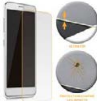
Film anticasse pour Iphone Iphone 5 et 5s Iphone 6 et 6s Iphone 7 Iphone 7PLUS