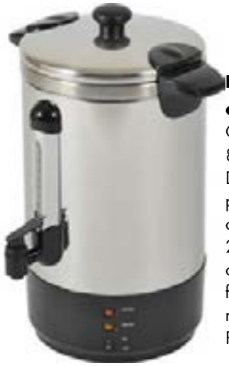
Percolateur à café Pro Cuve 15 litres 80-100 tasses Double paroi isolante pour le maintien au chaud 2 systèmes de chauffe : 1 pour la filtration, 1 pour le maintien au chaud Panier filtrant en inox