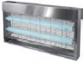
Tues-mouches inox 80W – Surface 200 m 2 Spécial agro-alimentaire