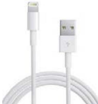
Cable d'origine Apple